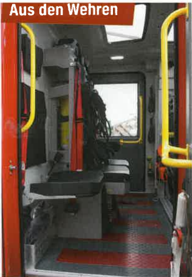
Blick in die Z-Cab mit Klappsitzen für den Wasser- und PA-Sitzen für den Angriffstrupp.

Weitere neue Fahrzeuge feuerwehrmagazin.de